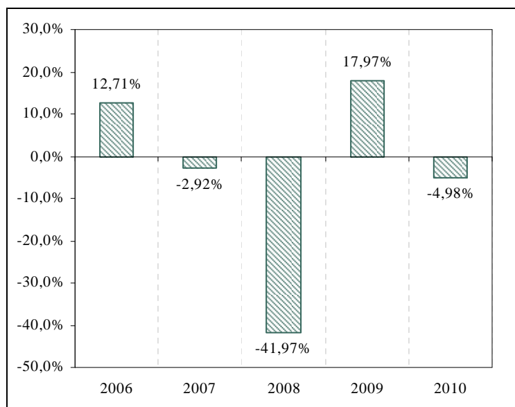
Performances annuelles (en %)